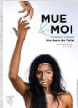
Création 2017 Théâtre visuel et sonore Tout public, pour les entendants et malentendants à partir de 7 ans