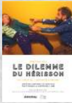
Création janvier 2023 Théâtre corporel et musical Tout public à partir de 7 ans