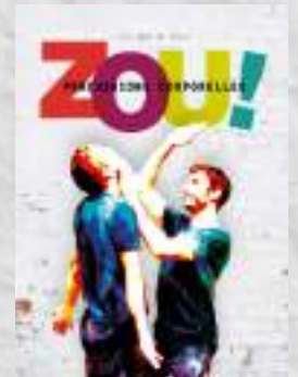
Création 2011 Duo de percussions corporelles Tout public