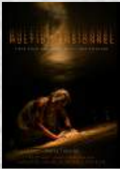
Création 2020 Pièce pour une danseuse et une peinture Tout public à partir de 11 ans