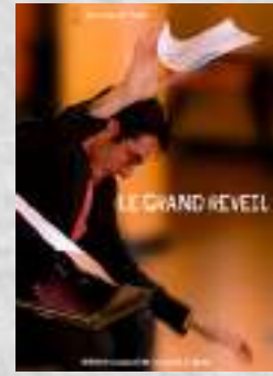
Création 2022 Théâtre musical de corps et d'objets Tout public à partir de 6 ans