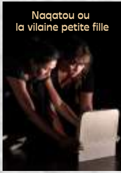
Création décembre 2023 Conte de corps et de papier 3 - 10 ans